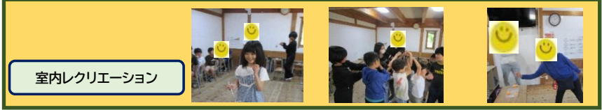
室内レクリエーション