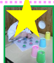
つまむ動作・色のマッチング