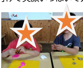
つぶつぶ粘土遊び