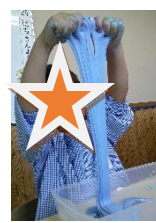
エンジェルクレイ