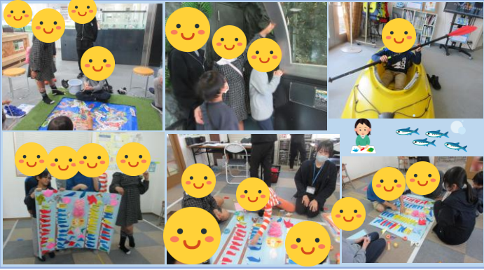
～壁面工作&くるめウス～ 5月の壁面工作のテーマ「鯉のぼり」ということでみんなには折り紙で鯉のぼりを折ってもらいました(*^-*) ジョウズニデキネ工作後は綺麗なお魚を見てリフレッシュできました(*´ω´)