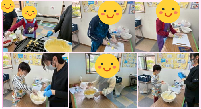
～ベビーカーラ作り～ 今回作るベビーカーラは一味違う!中に色々な食材を入れるという新たな試みを行いました☆ワクワクしながら食材を切ってカステラの中に入れていきました♪。(´ω-)ドン!アジ!グツグツ!