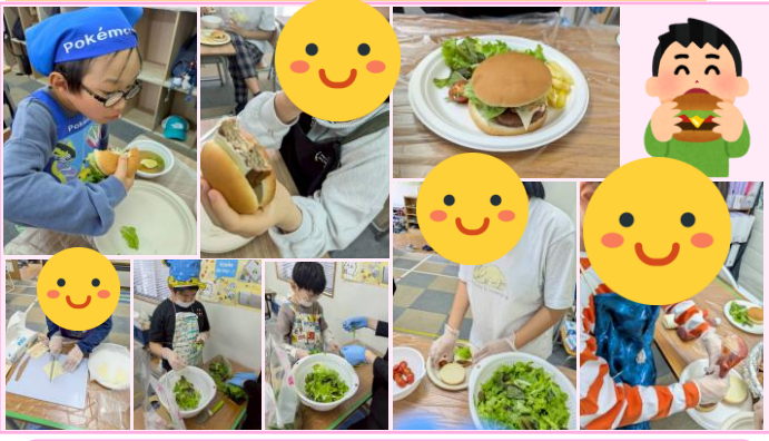
～ハンバーガー作り～ この日はみんな大好きハンバーガーを作りました!(*'▽') 食材を切ったり、盛り付けたりして、ハンバーガーを作ることができました(*^*)みんな美味しそうに頬張ってくれました♪

*送迎時間の指定のある方につきましては、ご希望にそえない場合もございますのでご了承ください。 *持ち物には全て記名し、毎利用時に必ず水筒を持たせていただきますようお願い致します。 *普段の利用曜日のほかに、利用定員に空きがある場合はご案内出来ますので、何かあればご相談ください。 ※天候及び利用状況などによりイベント内容等を変更する場合がございます。